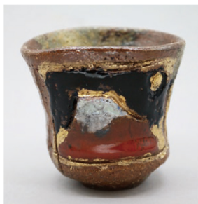
安倍安人 彩色備前酒器 h6.2×w6.6cm