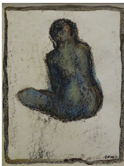
古茂田守介 裸婦 25.5×20cm 紙、パステル、水彩