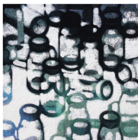
中西良 朝の音 4S キャンパス、油彩