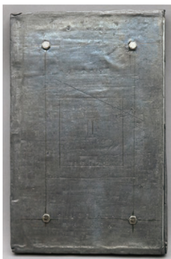
矢原繁長 封印 鉛(中に詩集) h22×w14.5×d2cm