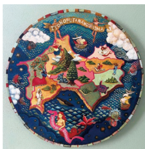
大場咲子 神秘の国 径40cm 油彩、キャンパス